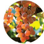
ブドウ発酵エキス