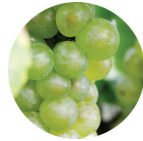
ブドウ果汁発酵液