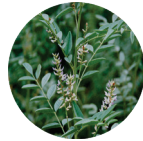
カンゾウ根エキス