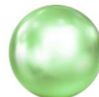
グリチルリチン酸 ジカリウム