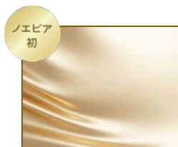
ゴールデンシルクエキス*1

シルクの中でも特に希少な「ゴールデンシルク」から抽出されたエキスを厳選し、パールから抽出されたエキスとともに配合。肌をなめらかに整えて、艶めきとハリ感をもたらします。