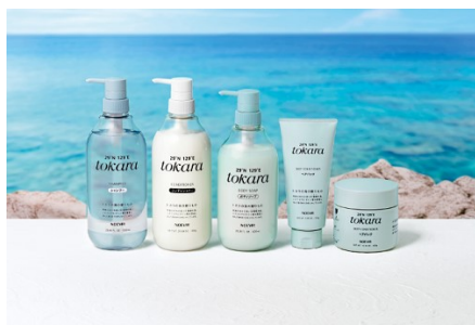
(左から)ノエビア トカラの海のシャンプー、同 コンディショナー、同 ボディソープ、同 ヘアパック<チューブタイプ>、同 ヘアパック

吐噺(トカラ)列島の海域の中でも特に流れの速い、黒潮の本流が流れるポイントで取水した海水を使用。その海水に含まれる貴重な微量のミネラル*1まで余すところなく取り出し、原料化しました。世界有数の透明度を誇るトカラの海のミネラルが、豊かなうるおいで髪や肌を包み込みます。オキナワモズクエキス*2やコラーゲン*3の配合により、髪や地肌、お肌を守り、豊かなうるおいを与えます。また、環境に配慮した、植物由来のバイオマスプラスチックを使用し、環境負荷低減に取り組んでいます。