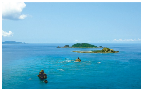
吐噺列島海域の海水から抽出した成分を配合