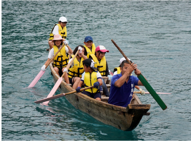
<舟漕ぎ大会の様子>