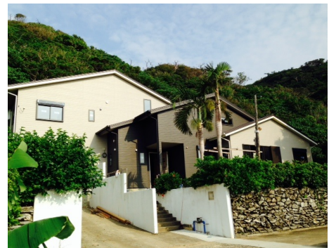
<与路グリーンハウス>