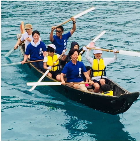
<舟漕ぎ大会の様子>