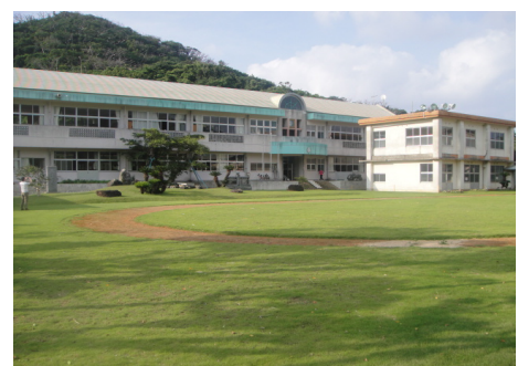
<瀬戸内町立与路小・中学校>