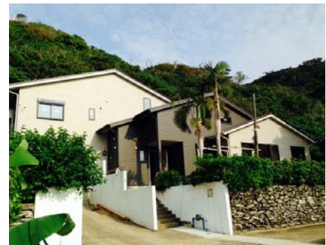
<与路グリーンハウス>