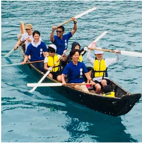
<舟漕ぎ大会の様子>