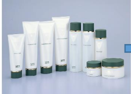
細胞間脂質に着目。