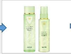
コラーゲン*2・ヒアルロン酸*3・アクアブラセンタ*4をプラス。