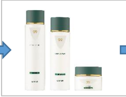
植物エキスに、フタバナヒルギ*1をプラス。