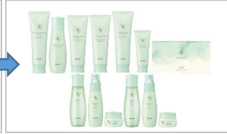
保湿の「質」を高める“スマート保湿”を実現。