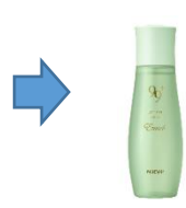
保湿の「質」を高める“スマート保湿”を強化し、高密度な潤いを実現。

*1 フタバナヒルギ葉エキス *2 加水分解コラーゲン、水溶性コラーゲン *3 ヒアルロン酸ヒドロキシプロピルトリモニウム、加水分解ヒアルロン酸 *4 ブラセンタエキス (全て保湿成分)