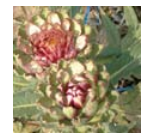
アーチチョーク葉エキス