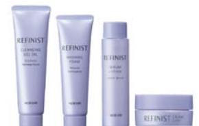
ノエビア リファイニスト トライアルセット