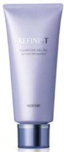
＜メイク落とし＞ ノエビア リファイニスト クレンジングジェルオイル