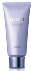
＜洗顔料＞ ノエビア リファイニスト ウォッシングフォーム