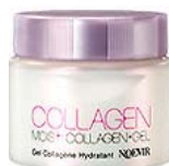
ノエビア モイストジェル