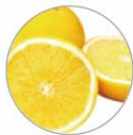
グレープフルーツ