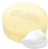
ノエビア モイストソープ

ノエビア モイストコラーゲンシリーズ ~洗顔からベースメイクまで簡単お手入れ完成!!~