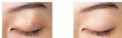
アイカラーベースを 使用しない場合