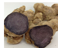
ブラックジンジャー

ポリメトキシフラボンはフラボノイド(植物に含まれるポリフェノールの一種)であり、ブラックジンジャーに豊富に含まれています。日常活動時のエネルギー代謝において脂肪を消費しやすくする作用により、腹部の脂肪を減らす機能があることが報告されています。