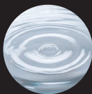
グリセリルグルコシド*1