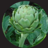
アーティチョーク*7