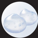
加水分解ヒアルロン酸*1