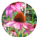
ムラサキバレンギク*1

セラミドの根源に着目し、厳選した3つの植物エキスと7つのセラミド関連成分を配合し、肌のうるおいを守ります。