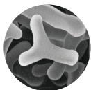
ビフィズス菌 発酵エキス*1

ビフィズス菌を培養して得られる「ビフィズス菌発酵エキス」など、4つの成分を配合。角層を整え、肌のバリア機能をサポートします。