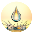
ダイレクト スムージングオイル*2