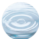
グリセリルグルコシド*5