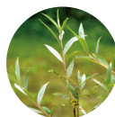
セイヨウ シロヤナギ*4

*1 ビフィズス菌培養液解質 *2 イソステアリン酸イソノニル *3 サガラムエキス *4 セイヨウシロヤナギ樹皮エキス (*1～4 全て保湿成分)