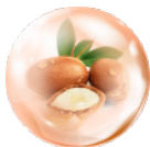
アルガンツリー幹細胞エキス