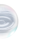
グリセリルグルコシド*11