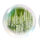
シロバナルーペイン*4