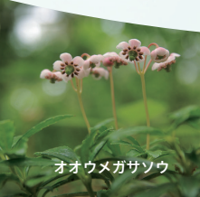
オオウメガサソウ