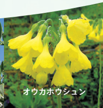
オウカホウジュン