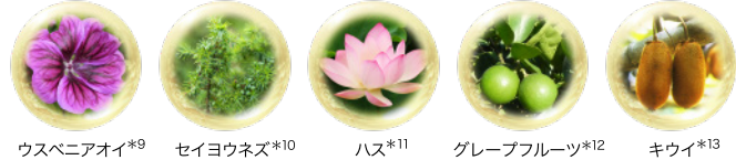
ウスベニアオイ *9 セイヨウネズ *10 ハス *11 グレープフルーツ *12 キウイ *13