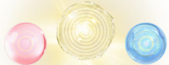
うるおいを与える 攻めのラメラカプセル