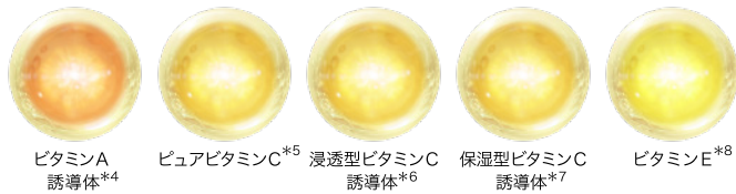
ビタミンA 誘導体 *4 ビュアビタミンC *5 浸透型ビタミンC 誘導体 *6 保湿型ビタミンC 誘導体 *7 ビタミンE *8

肌の「くすみ *1 」に着目し、ビタミンACE *2 と厳選した植物エキスを配合。肌のキメを整え、透明感 *3 をもたらします。