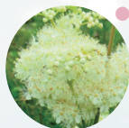
メドウスイート*2 (ノエビアオリジナル)

ノエビアオリジナルの植物エキスなど清らかでハリのあるふっくらとした肌をサポートする8種類の植物エキスを配合しました。