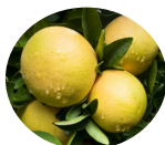
グレープフルーツ