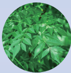
メリア アザジラクタ*7