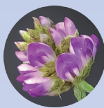
次世代レチノール と呼ばれている バクチオール*2