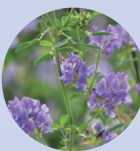
ブルーライトを吸収 アルファルファ*8