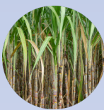
コクトウ*3 (サトウキビ)