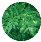
メリア アザジラクタ*7