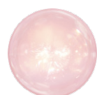
ナイアシンアミド*1

美容成分ナイアシンアミドと、次世代レチノールと呼ばれているバクチオールやコクトウを含む、8種類の厳選した植物エキスを配合。 うるおった明るい目もとに導きます。