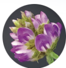
次世代レチノール と呼ばれている バクチオール*2