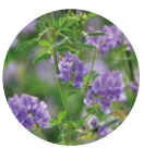
ブルーライトを吸収 アルファルファ*8