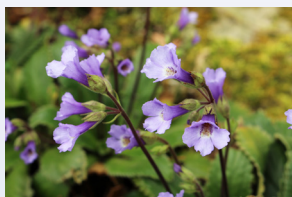
ハベルレアロドペンシス

乾燥状態でも生き続け、枯れたように見えてもよみがえる「復活草」のひとつである「ハベルレアロドペンシス* 1 」。植物培養技術を応用してエキスを抽出しました。乾燥によるダメージから守り、いきいきとした肌へと導きます。