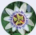
クダモノトケイソウ*2