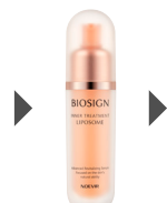
バイオサイン インナートリートメント リポソーム