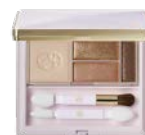
アイカラー カシミアブラウン