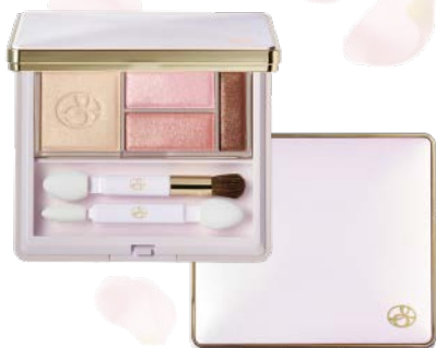
スペチアーレ アイカラー リフィール (チップ&ブラシ付) 各¥6,000 (税込¥6,600)