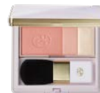
チーク アプリコットベージュ