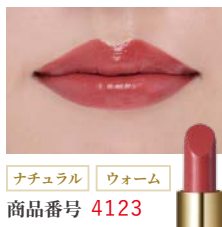
ナチュラル ウォーム 商品番号 4123