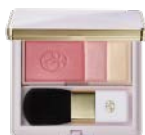
チーク ローズピンク