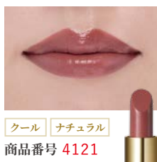
クール ナチュラル 商品番号 4121