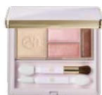
アイカラー シルキーピンク