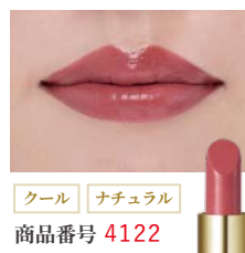
クール ナチュラル 商品番号 4122