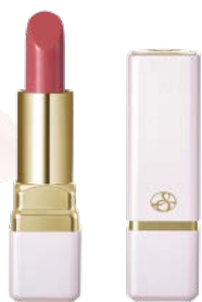
スペチアーレ セラムリップスティック 各¥7,000 (税込¥7,700)