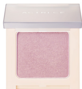
シアーライラック

アイカラーとしてアイホールに。 ハイライトとして、Tゾーン・目の下・あご先などに。