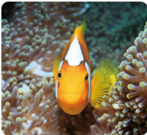
中村征夫写真展 海中を彩る仲間たち