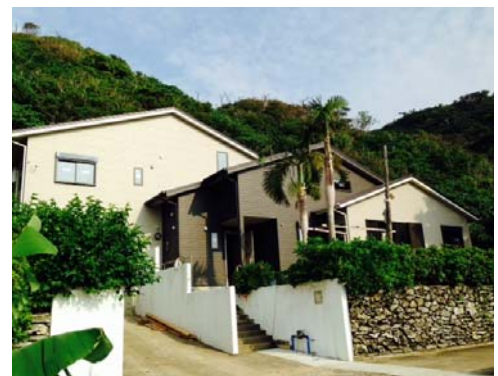
<与路グリーンハウス>