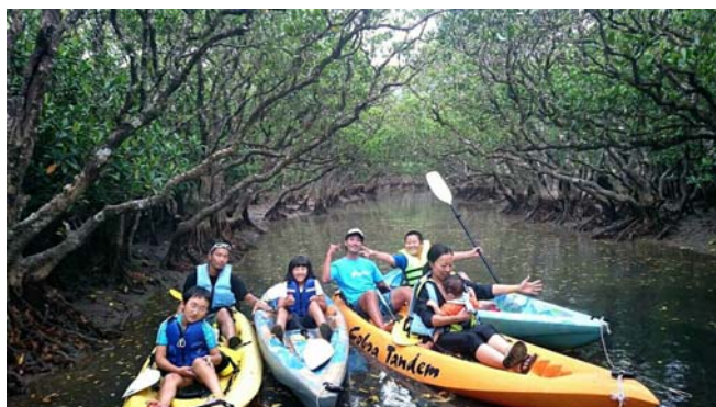
<マングローブでカヌー体験>