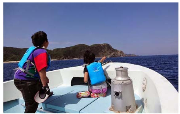
<春の一日遠足 海釣り>