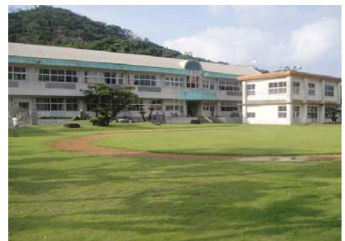
<瀬戸内町立与路小・中学校>