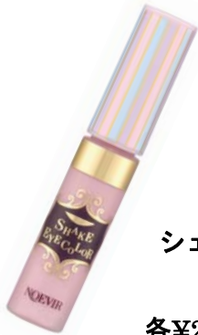
ノエビア シェイクアイカラー (全3色)