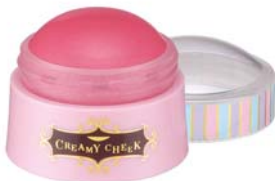
ノエビア クリーミィチーク (全2色)