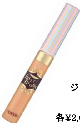
ノエビア ジェリーグロス (全3色)